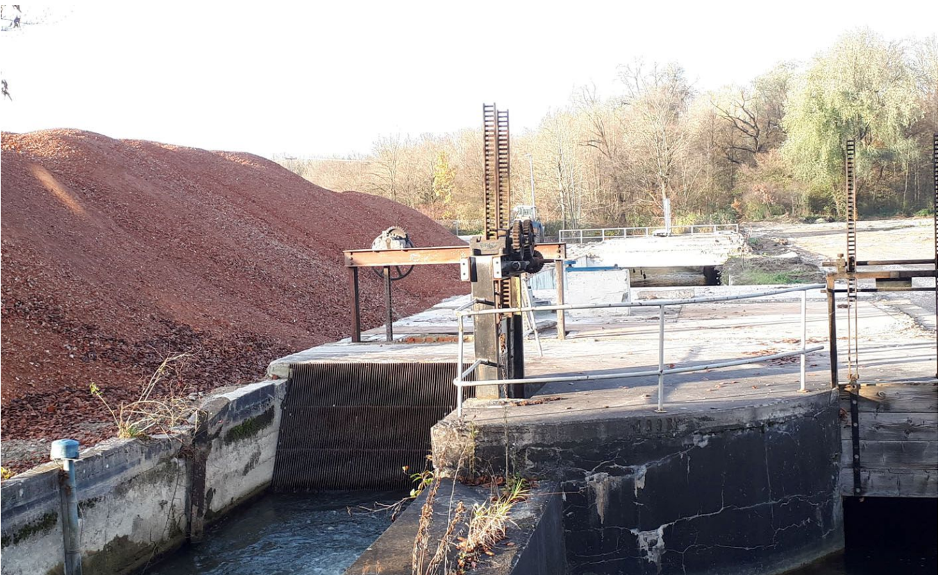
Foto vor dem Umbau