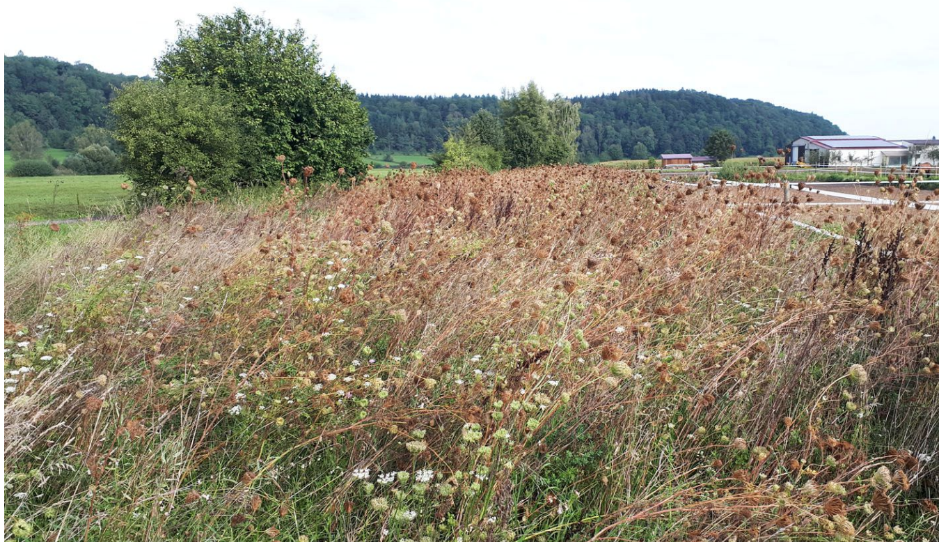
Herbstaspekt Flurstücke 3458

Bisher waren die drei Flurstücke als Wirtschaftsgrünland genutzt. Auf den Parzellen 3547 und 3555 erfolgte bereits im Spätsommer 2019 auf Wunsch des BUND eine einmalige Mahd mit Abtransport des Mähguts, und diese beiden Flurstücke auszumagern. Auf dem Flurstück 3458 war im September 2019 der Herbstaspekt noch zu erkennen.